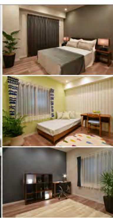
※掲載写真/H30.12月撮影 一部オプションが含まれている他、家具・備品等は配置例を示したもので販売価格には含まれません。